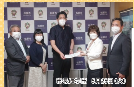
市長に提出 5月25日(火)