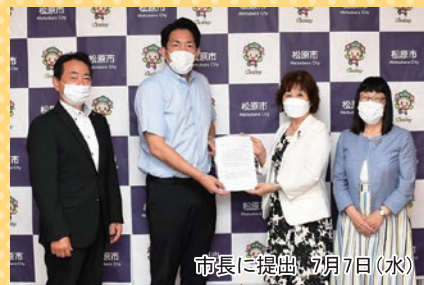
市長に提出 7月7日(水)