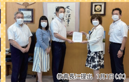
教育長に提出 7月7日(水)