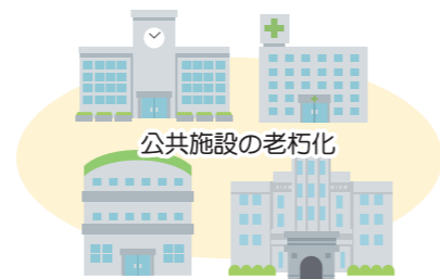
公共施設の老朽化