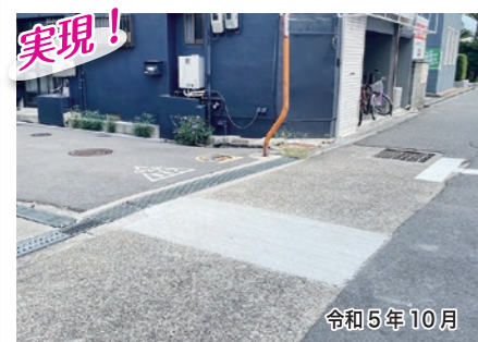
実現! 天美東5-3-6付近 道路復旧整備をさせていただきました。