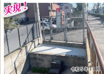
実現! 天美東2-156-26 西辺写真館前の側溝の整備をさせていただきました。