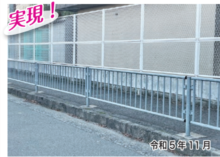
実現! 松原市立天美北小学校前の歩道にある防護柵ですが、破損している箇所を新しくさせていただき、子どもの安全確保に努めました。