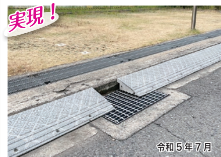
実現! 三宅中8-2-8 株式会社アバンテ前のグレーチングが腐食していたため、新しいものに変えさせていただきました。