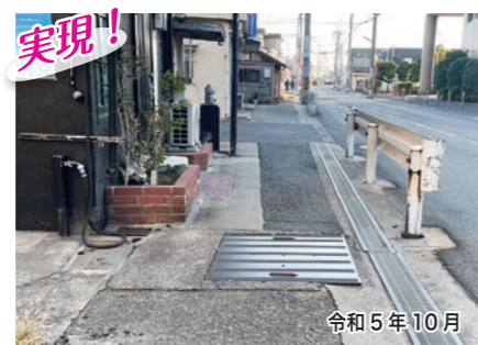
実現! 三宅中4-2-24付近 北中美創前の歩道にある鉄板のガタツキと、滑り止めシートを貼らせていただき、安全確保に努めました。