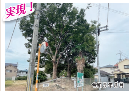
実現! 一津屋5-12-10付近 一津屋荘園三角公園の樹木が電線にもたれかかっていたため、地域住民の安全確保の観点から早急に樹木の伐採をさせていただきました。