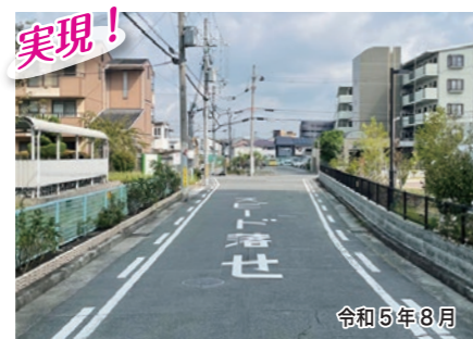
実現! 一津屋2-8-1付近 一津屋団地横の道路に、安全対策のためスピード落せの道路標示をさせていただきました。