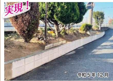
実現! 松原市別所6-11-22付近 法面を支えるブロック塀が道路側に倒れており、歩行者の安全確保のため、修繕をさせていただきました。