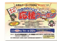
▲第1回目のクーポン冊子

第2回クーポンは、松原市最大のイベント『まつばらマルシェ』とコラボし、11月に全戸配布。