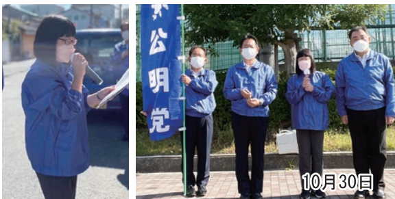
▲大阪府本部一斉街頭演説