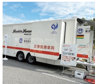
▲ぼうさいこくたいに参加 in 兵庫に参加