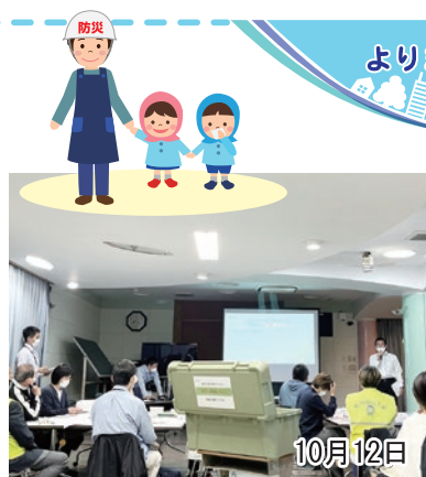
▲松原北小学校にて避難所運営 マニュアル説明会に防災士として参加