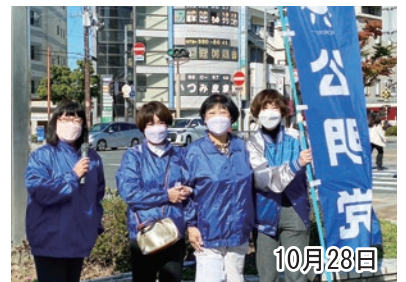
▲南大阪女性局 ピンクリボン街頭演説