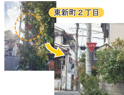
▲止まれの標識が見えにくいため剪定