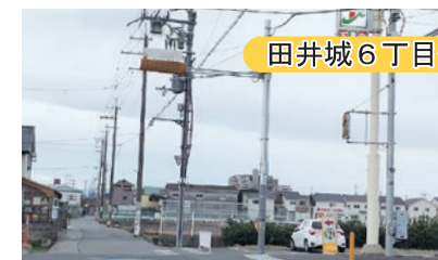
▲車両用感知信号機の設置