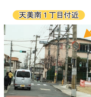
▲カーブミラー設置