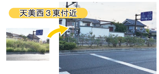
▲大阪狭山線中央分離帯の草伐採