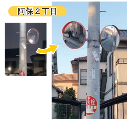
▲カーブミラー(片側から両側)設置