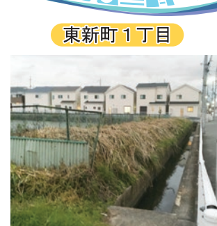
▲水路の草が生い茂り視界が悪く除去