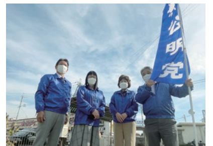
▲衆議院議員選挙・御礼街頭(河内松原駅)