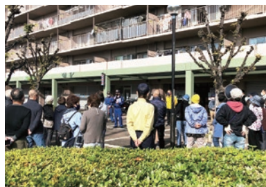
▲地元サンシティ松原にて 消防訓練