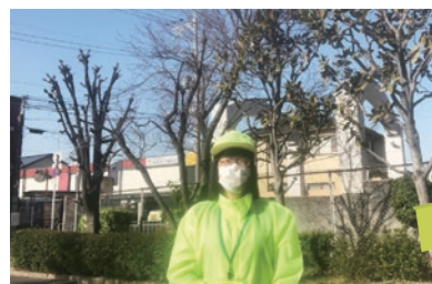
▲中央小学校、見守り隊