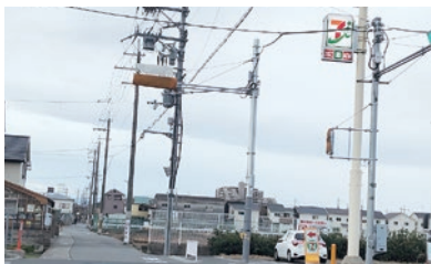
▲田井城6丁目付近 長年にわたる地域の方々がの声が届き、車両用感知信号機が設置開始(1月29日)