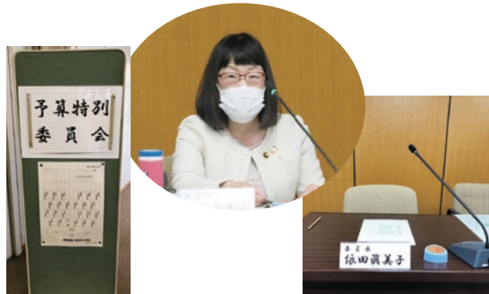
▲初めての予算特別委員会、委員長を務める(3月12~16日)