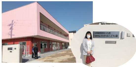
▲公立認定こども園「わかばこども園」見学(3月24日)