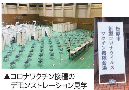
▲コロナワクチン接種のデモンストレーション見学(3月27日)