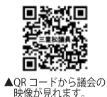
▲QRコードから議会の映像が見れます。