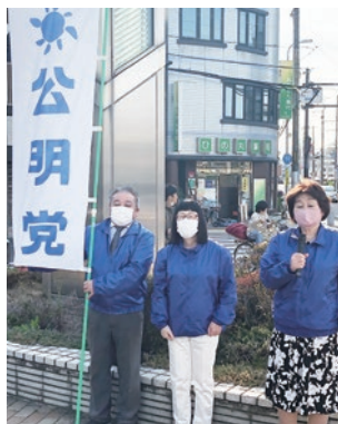
◀松原駅前 街頭演説(3月27日)