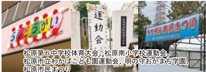
松原第6中学校体育大会、松原南小学校運動会、松原市立わかほこども園運動会、明の守おがまち学園、松原市民まつり