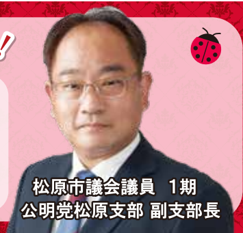
松原市議会議員 1期 公明党松原支部 副支部長