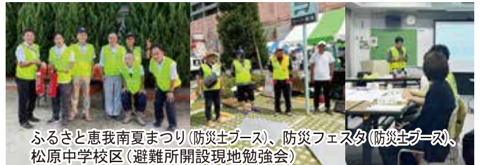
ふるさと恵我南夏まつり(防災士ブース)、防災フェスタ(防災士ブース)、松原中学校区(避難所開設現地勉強会)